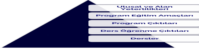
Şekil: KTO Karatay Üniversitesi Bologna Ölçüm Sistemi

Bologna Süreci çalışmaları bir ölçüm sistemi perspektifiyle yürütülmektedir. Bu ölçüm sisteminin temel parçaları aşağıdaki şekilde gösterilmektedir.