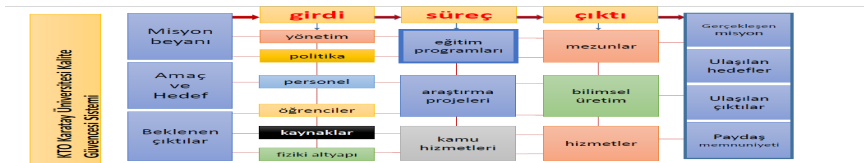
Şekil: KTO Karatay Üniversitesi Kalite Güvence Sistemi

Bu bağlamda kalite güvence süreci bütüncül bir anlayışla ve ulaşılan hedefleri paydaşlar ve mezunlar odaklı olarak değerlendirmeye alan bir kurguda tasarlanmaktadır.